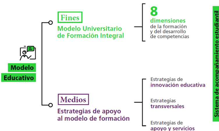
FIGURA 1. El Modelo Educativo de la UASLP considera tanto los fines como los medios para lograr una formación integral de los estudiantes.

Por lo anteriormente expuesto, y aunado al supuesto de que los egresados tengan la capacidad de ejercer la profesión cuidando aspectos de sustentabilidad, por ejemplo, un IME tenga la capacidad de diseñar sistemas electromecánicos que funcionen con un consumo mínimo de energía, y/o que esa energía consumida sea limpia, utilizando materiales amigables con el medio ambiente, un IA que aproveche la materia prima local para desarrollar productos que mejoren los ingresos de las familias pero que a su vez se asegure la sostenibilidad y sustentabilidad, por ejemplo. Estas responsabilidad cae a costas de los académicos partícipes en la formación de profesionales, lo que hace urgente diseñar estrategias que permitan incluir aspectos de cuidado del medio ambiente y responsabilidad social en los programas educativos de la Coordinación Académica Región Huasteca Sur, el primer paso ha iniciado trabajos de reflexión para que a través del trabajo colaborativo e multidisciplinario