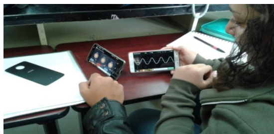
FIGURA 1. Los alumnos realizando las actividades de las CDIs con las aplicaciones descargadas en los tel3fonos celulares.

Si bien el paso 6 menciona “El instructor realiza la demostraci3n y exhibe los datos”, se les pide a los alumnos que integrados en equipos de 3 personas realicen cada una de las actividades (con el apoyo y gui3 del profesor) utilizando las aplicaciones en sus celulares.