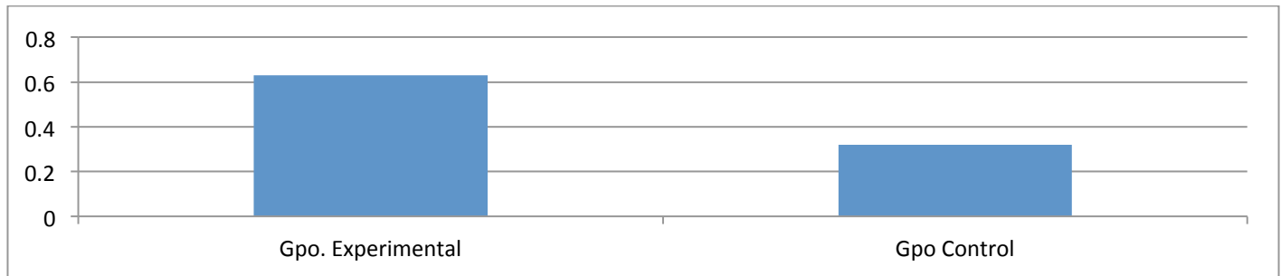
FIGURA 2. Comparación del Factor de Hake obtenido por el Grupo de Control y el Grupo Experimental

Ambas ganancias se encuentran dentro de la zona de ganancia media, sin embargo la ganancia del Grupo Experimental tiende al límite de la ganancia alta, por lo que se puede decir que las CDIs favorecieron la comprensión de los conceptos relacionados con las características físicas y subjetivas del sonido.