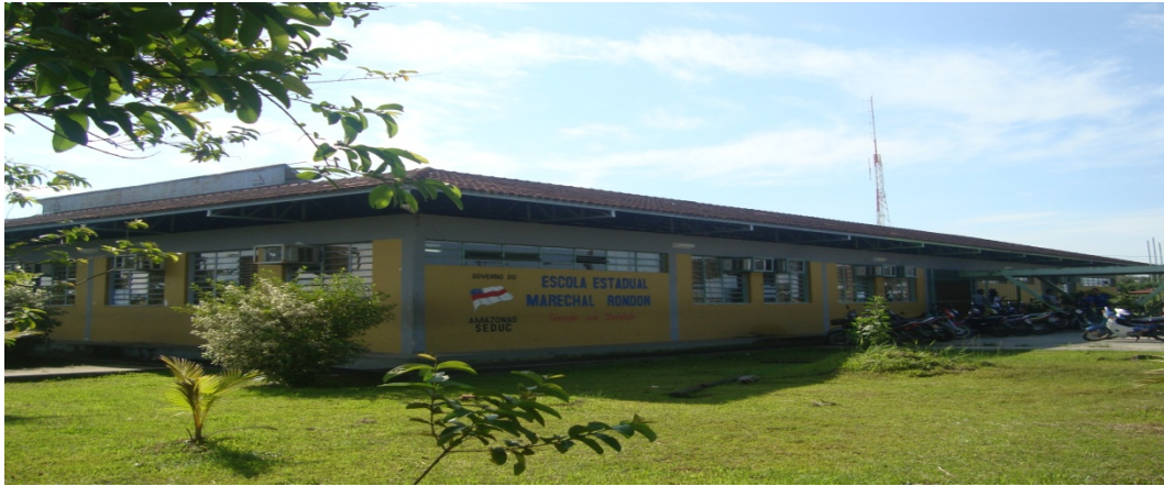
FIGURA 4. Escola Estadual Marechal Rondon, a terceira escola a ser observada em relação ao ensino/aprendizagem da geografia, destacando a teoria e a prática dos professores nas aulas de geografia.

Na atualidade funciona com três turnos (matutino, vespertino e noturno), com um total de 1.704 alunos matriculados, distribuídos assim: 2º ao 5º ano do I Ciclo com 721 estudantes; 6º ao 9º ano do Ensino Fundamental com 570 estudantes e Ensino Médio com 413 estudantes e 54 professores.