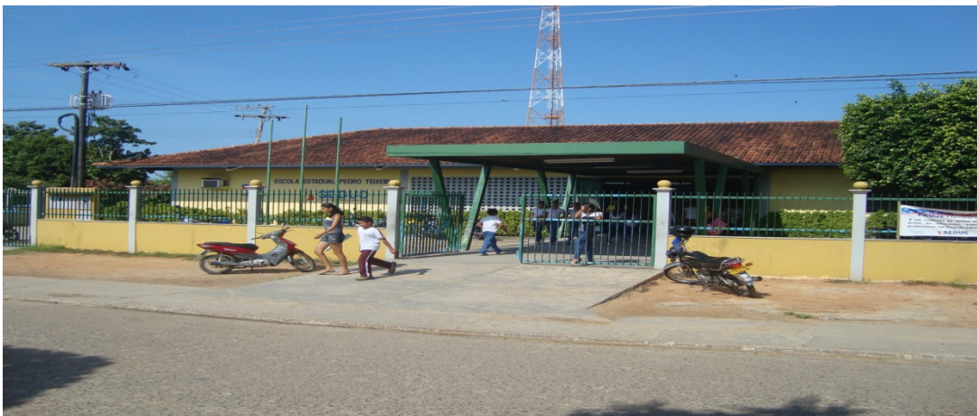
FIGURA 2. Escola Estadual Pedro Teixeira, a primeira escola a ser observada em relação ao ensino/aprendizagem da geografia, destacando a teoria e a prática dos professores nas aulas de geografia.