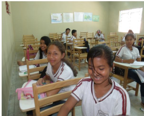
FIGURA 6. Alunos do Ensino Fundamental assistindo as aulas de geografia.

Com as observações realizadas nas salas de aula, e entrevistas com professores e alunos foi constatado que as aulas de Geografia vêm sendo aplicada pelos professores de maneira tradicional. Onde os professores desenvolvem suas aulas utilizando o conteúdo do livro didático, copiam os textos no quadro ou mandam os alunos copiar diretamente do livro utilizando muitas vezes apenas a ideia contida no livro. Para Teixeira (1962) “A formação dos mestres do amanhã precisaria romper com a pragnância do tradicional, enganjando-se no enfrentamento dos descaminhos da cultura tecnológica e consumista e na apropriação do pensamento científico de modo a dominá-lo e a servir-se deles, assegurando a todos a educação capaz de enriquecer a vida no planeta”.