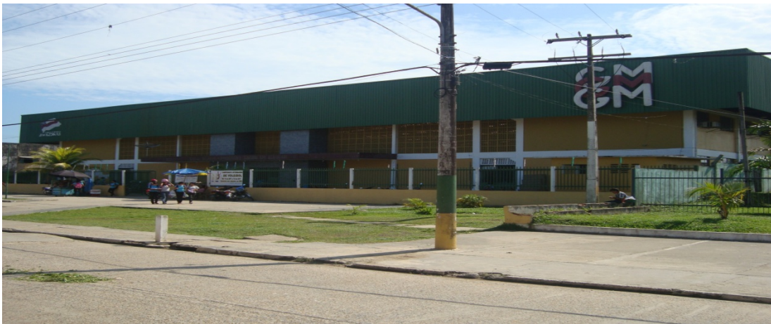
FIGURA 3. Escola Estadual Conceição Xavier de Alencar, a segunda escola a ser observada em relação ao ensino/aprendizagem da geografia, destacando a teoria e a prática dos professores nas aulas de geografia.

O ato de criação do Colégio Pedro Teixeira foi através do Decreto N. 6998 de 07 de fevereiro de 1.983. A escola Pedro Teixeira na atualidade funciona nos períodos matutino das 07:00 às 11:15 horas, no período vespertino das 13:00 às 17:15 horas e no período noturno das 19:00 às 22:30 horas , oferecendo como modalidade de ensino o ciclo 1 que vai do 1º ao 5º ano , ciclo fundamental que vai do 6º ao 9º ano , o ensino médio regular do 1º ao 3º ano e a EJA (Educação de Jovens e Adultos) em dois ciclos 1º seguimento e 2º seguimento, conta atualmente com 1.209 alunos distribuído em seus três períodos de atuação, conta ainda com 48 professores, 22 funcionários, 2 apoio pedagógico.