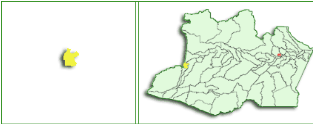
FIGURA 1. Localização da área de estudo, mapa do Estado do Amazonas e em destaque mapa do município de Tabatinga.

florestas (altas, baixas e pouco densas) e, hidrograficamente, pertence à Bacia Amazônica, sendo banhada pelos rios Solimões, Içá, Japurá. Possui uma área de 3.239,3 km 2 . Segundo o IBGE, 2010 a população soma 52.293 habitantes.