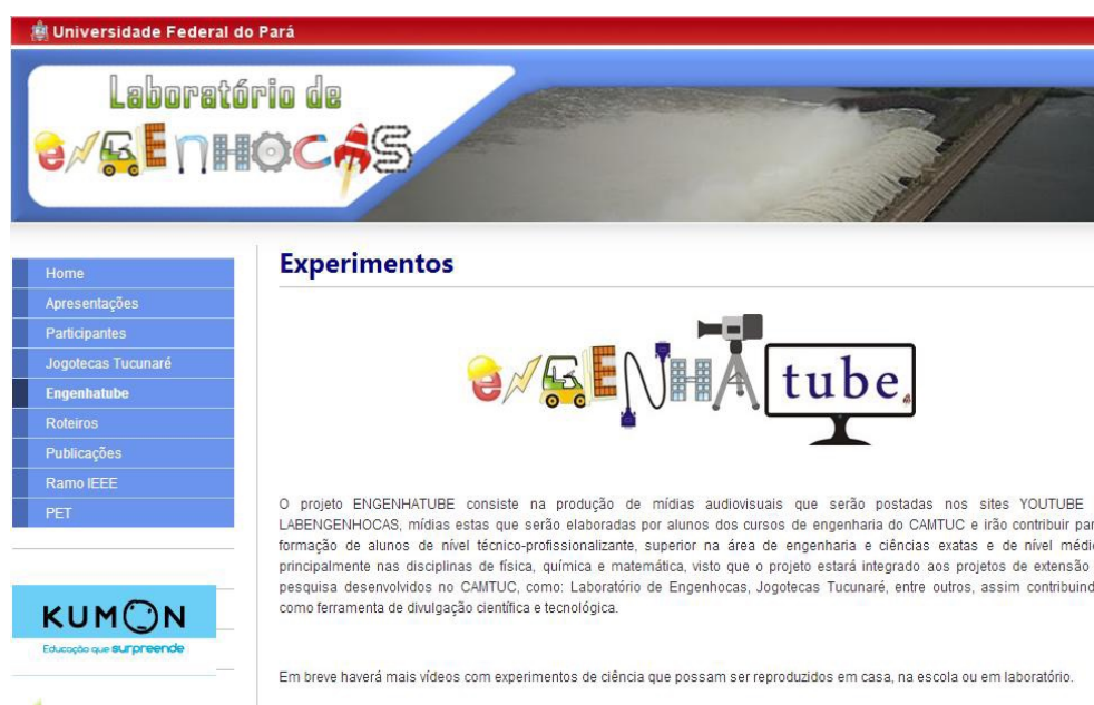
FIGURA 1. Website do Laboratório de Engenhocas.

Com isso, as atividades do projeto abrangeram-se pela participação direta das práticas desenvolvidas por bolsistas do programa Laboratório de Engenhocas, além do acompanhamento das atividades do Ramo Estudantil IEEE e na Semana de Engenharia. Na montagem da aparência do site inseriram-se abas direcionadas para o desenvolvimento dos projetos integrante do programa e do Ramo Estudantil.