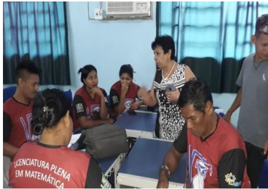
Figura 07: Equipe Kanamary, organizando sua proposta de apresentação da Atividade integradora.

A professora regente começou a aula com a técnica do Conto da Fala , o aluno deveria continuar o pensamento da fala do colega anterior. Esta motivação foi bem interessante, o primeiro aluno começou a falar sobre o dia anterior que estudaram sobre resumo e resenha e pontuando a diferença; outro aluno deu continuidade ao pensamento. No quinto aluno, o pensamento inicial não estava mais sendo citado, ele destacou o a cultura de sua aldeia. Esta técnica leva o aluno a ter concentração e desenvolve o pensamento cognitivo, o raciocínio lógico, coerência em sua fala e organização do pensamento.