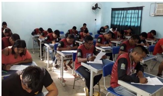
Figura 17: Avaliação final. Os acadêmicos foram obtiveram um melhor desempenho ao redigir e respondeu sua avaliação, utilizando a língua portuguesa.

Na aplicação da avaliação final, ver figura 17, a professora regente fez a correção, o lançamento na planilha de avaliação. Todos os alunos assinaram e ficaram cientes de suas notas.