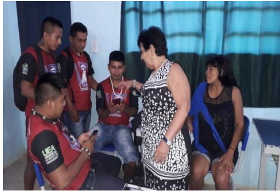
Figura 04: Equipe Marubo sendo orientados pela professora regente.

Após este momento, os alunos reuniram-se em equipes por etnia para pesquisar, definir e organizar a Atividade Integradora , com a orientação da professora e da estagiária.