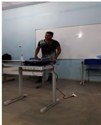
Figura 11: Equipe Ribeirinha

A equipe ribeirinha, ver figura 11, fez um breve relato. A equipe Matis, ver figura 12, apresentou no slide uma das suas crenças. A criança e o (a) adolescente devem passar por um ritual onde os mais velhos se pintam todo de preto e colam folhas de samambaias no corpo e se agacham, e com um cipó a criança ou o (a) adolescente entra na oca, recebe chicotadas nas costas, para que perca o medo dos animais e quando crescerem se tornarem corajosos e guerreiros. A equipe Kulina apresentou uma sinopse de sua etnia, ver figura 13.