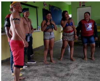
Figura 14: Equipe Kanamary

A equipe Kanamary, ver figura 14, Mayuruna, ver figura 15, e, a equipe Marubo, ver figura 16, fizeram uma breve explicação do que fazem na aldeia e apresentaram um ritual de dança para trazer prosperidade a etnias.