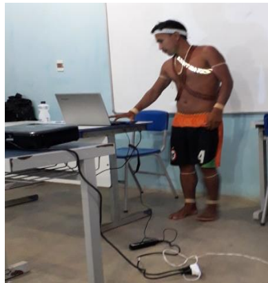
Figura 12: Equipe Matis