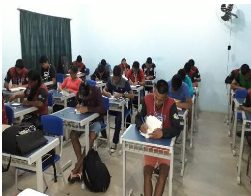
Figura 10: 2ª Avaliação os acadêmicos elaboram um fichamento.

O tema da aula foi “Seminários e projetos, Normas técnicas de trabalhos acadêmicos”, sendo esta expositiva e dialogada através de slides . A professora, em conjunto com os alunos, descreveu as partes pré-textuais de um trabalho acadêmico.