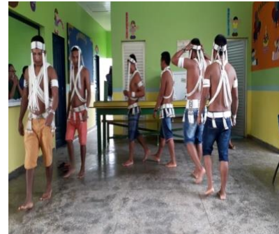
Figura 16: Ritual da prosperidade

Neste dia, a professora fez algumas considerações da atividade integradora, em que todos estavam de parabéns por terem se empenhado e apresentarem um pouco de sua cultura.