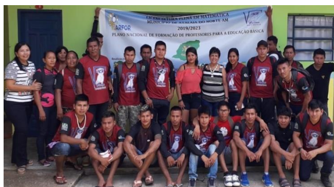
Figura 18: Turma do 1º período de Licenciatura em Matemática.

Ao finalizar a disciplina, a professora regente fez suas considerações em relação ao desenvolvimento da turma. Ela agradeceu o compromisso e a responsabilidade assumida por todos, cumprindo o “Contrato Didático”. A estagiária fez suas considerações, agradecendo e estimulando a turma em continuarem estudando. Por fim, alguns alunos fizeram agradecimentos para a professora regente, pelo empenho e dedicação em ensiná-los não somente o conteúdo programático da disciplina, como também a promover uma reflexão quanto sua vida pessoal, acadêmica e profissional.