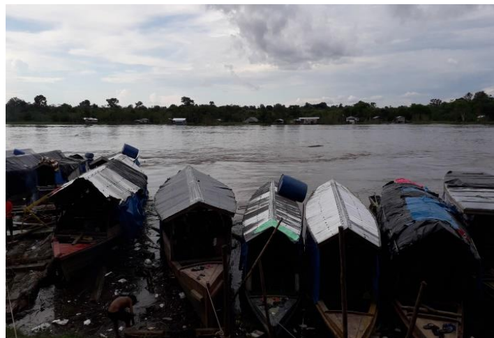
Figura 2: Os barcos dos acadêmicos, onde eles ficam alojados durante o período que vem realizar as disciplinas em Atalaia do Norte.

Após a professora regente realizar a frequência, a estagiária explicou para turma que eles precisariam realizar a Atividade Integradora. Esta é uma atividade de carga horária de 200 horas eletivas a serem cumpridas durante o período de todo o curso. Em cada disciplina eles precisam realizar essa atividade integradora para o cumprimento de 8 horas/aulas. Como proposta, eles iriam apresentar a característica de sua etnia/cultura, e por serem professores em suas aldeias, iriam expor como abordariam os alunos. O dia da apresentação foi dia 28 de fevereiro, no horário noturno.