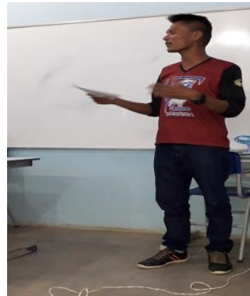
Figura 13: Equipe Kulina

A equipe Kanamary, ver figura 14, Mayuruna, ver figura 15, e, a equipe Marubo, ver figura 16, fizeram uma breve explicação do que fazem na aldeia e apresentaram um ritual de dança para trazer prosperidade a etnias.