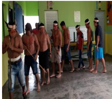
Figura 15: Ritual da caça