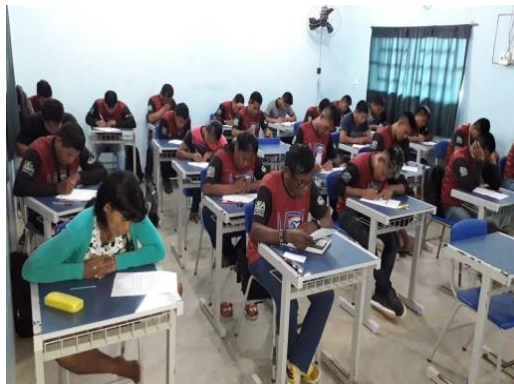
Figura 08: 1ª Avaliação para os acadêmicos pelo uso de sua língua materna, alguns demonstraram ter dificuldade em organizar a ideia do texto na língua portuguesa.

Com efeito, realizaram a primeira avaliação, ver na figura 08, escreveram um Resumo do Texto: A importância do hábito de ler (CRISTINE, 2015). Destacando a palavra-chave. A professora regente fez a correção e elencou alguns erros, no quadro branco, para serem discutidos e melhorados pelos alunos.