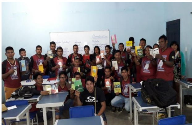
Figura 09: Doação dos livros, para que pudéssemos abordar os conteúdos resenha, fichamento, resumo e demais da ementa da disciplina. A professora regente fez doação de livros para os acadêmicos.

No período da tarde, a professora realizou a explanação do conteúdo: Relatório e Artigos acadêmicos, através de slides com o auxílio da estagiária/mestranda, que apresentou alguns exemplos de relatório e artigos acadêmicos. Os alunos fizeram questionamentos e as discussões participativas. Eles fizeram as anotações no caderno por não terem acesso ao livro didático. Uma das dificuldades encontradas foi à falta de livros acadêmicos para auxiliar os alunos em suas leituras e pesquisas.