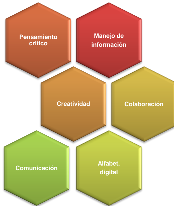
FIGURA 6. Algunas de las habilidades del siglo XXI.