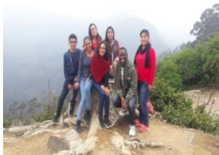
FIGURA 6. Salida ecológica al Cerro de Monserrate en Bogotá

Durante el desarrollo de la pasantía, se tuvo la oportunidad de hacer recorridos por algunos sitios turísticos de la ciudad, como se aprecia en la Figura 6.