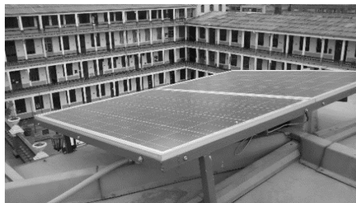
FIGURA 2. Foto de los paneles solares del sistema solar evaluado.