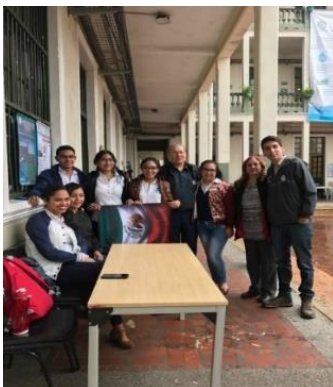
FIGURA 5. Participación en la X Jornada de la Tierra 2017 en la ET.ITC

En la Figura 5 se aprecia la participación de los estudiantes pasantes en la X Jornada de la Tierra desarrollada en la ET.ITC, donde expusieron los avances de sus resultados.