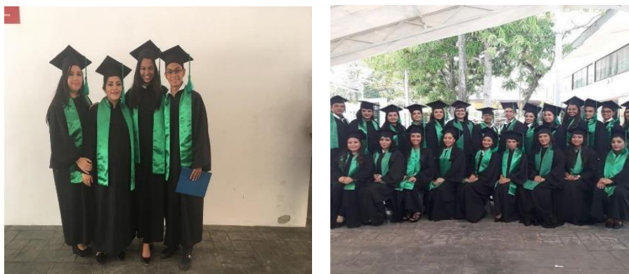
FIGURA 7. a) Estudiantes de los dos grupos de trabajo el día de su graduación. y b) El grupo general de graduandos en Ingeniería Ambiental en el segundo semestre de 2017 en la Universidad Tecnológica de Tabasco