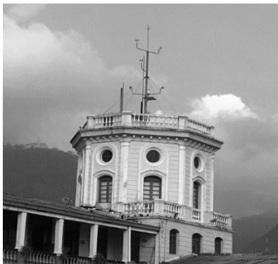
FIGURA 1. Foto de estación meteorológica de la ET.ITC

Los instrumentos y equipos utilizados fueron: la estación meteorológica de la ETITC. (Figura 1); el sistema solar de la ETITC, (Figura 2), y los equipos de medición eléctrica (Figura 3 a) y b)