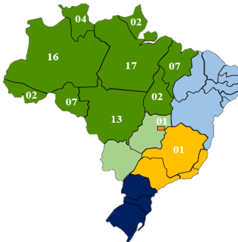
FIGURA 2. Localização atual dos doutores formados pela REAMEC até 2017.

Sobre os egressos, até dezembro de 2017, setenta e dois doutores foram formados pela Rede. Considerando o número de doutores formados até 2017 (72), e o número de doutorandos da terceira (60) e quarta turma (30) tem-se perspectivas reais que a meta da REAMEC, de formar 150 doutores para a região até o ano de 2020, se concretize. A Erro! Fonte de referência não encontrada. mostra a localização geográfica onde atuam os 72 doutores no ano de 2018.