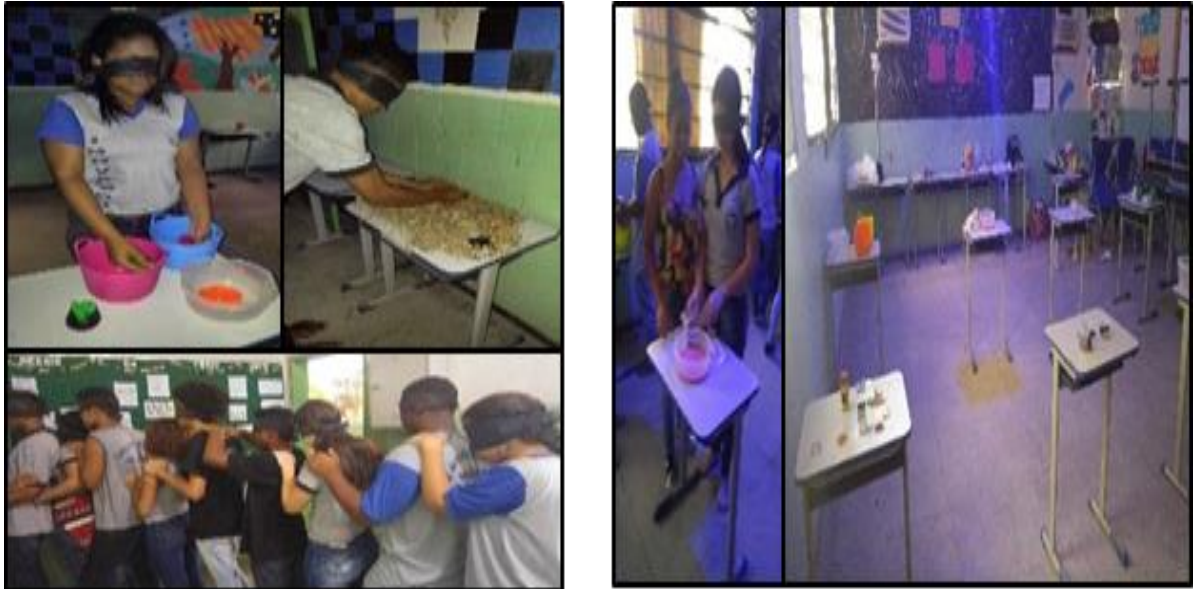
FIGURA 3: Momentos da prática sensorial

Para análise e interpretação dos dados foi utilizado o método quantitativo nas questões objetivas e o método qualitativo em uma questão (12 a . pergunta do questionário). O método quantitativo, após a tabulação dos dados, a análise ocorreu a partir da frequência das respostas dadas a cada questão, onde os resultados são apresentados em percentuais ao longo do texto e/ou na forma de gráficos. Já no método qualitativo, elegemos a metodologia da Tematização de Fontoura (2011). Por essa ótica de análise procura-se representar os sujeitos com as suas subjetividades e por isso torna-se imprescindível que o pesquisador “relate os procedimentos a seus leitores de forma clara, para que entendam os processos de escolha e de análise” (Fontoura, 2011).