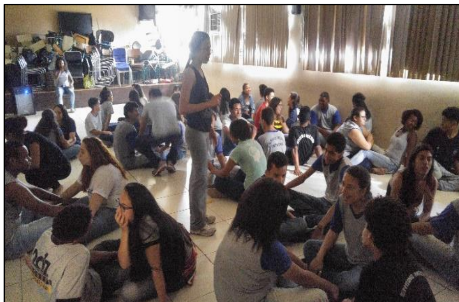
FIGURA 2: Alunos sentados um em frente ao outro se olhando e tocando rostos

Essa atividade dispôs os participantes em duplas (figura 2). Eles receberam instruções claras que deveriam se sentar de frente para o outro e ficar olhando no olho do outro. A segunda instrução foi que, por meio de gestos carinhosos, tocassem o rosto do par, sentindo e percebendo o toque. No início era nítido o constrangimento que aos poucos foi sendo rompido.