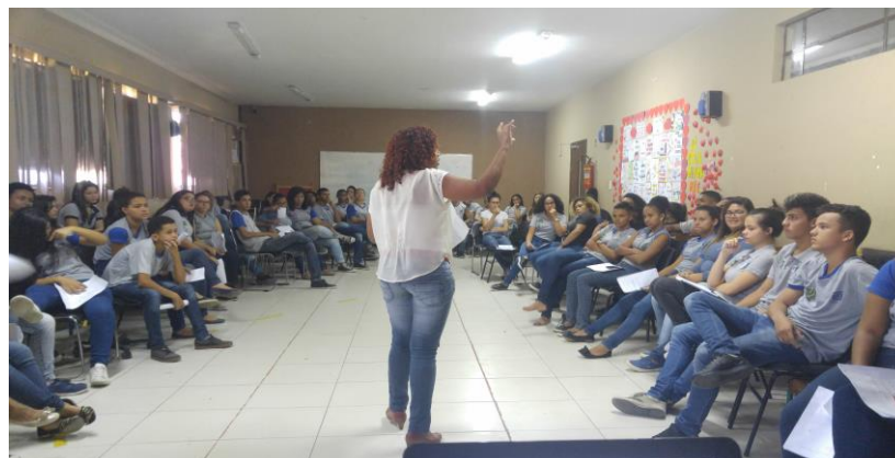
FIGURA 1: Mesa Redonda: na foto a professora de Língua Portuguesa na sua fala.

Nesse momento, três pessoas se apresentaram. A primeira delas, Professora de Língua Portuguesa (figura 1) e graduada em Psicologia. A mesma abordou a temática sexualidade sob um viés histórico, propondo reflexões acerca das curiosidades da nossa sociedade sobre o assunto em seus diversos momentos da História. A segunda, de Sociologia, conduziu seus momentos sempre em busca de alguns objetivos, dentre eles: promover reflexão sobre as desigualdades que estão presentes na sociedade, compreendendo a realidade de grupos minoritários; explicar o que são grupos minoritários e elucidar como os fatores atingem os grupos minoritários/de vulneráveis. Já a terceira, de Biologia, buscou apresentar os conteúdos de corpo, gênero e sexualidade apresentando as diferenças em um cromossomo, alguns níveis químicos (hormônios) e o tamanho dos gametas. Nos minutos de sua fala, a professora demonstrou que existem uma gama de ciências que explicam o comportamento dos indivíduos, bem como um conjunto possibilidades de rearranjos cromossômiais diferentes de XX e XY (comumente utilizados para nomear “macho” e “fêmea”).