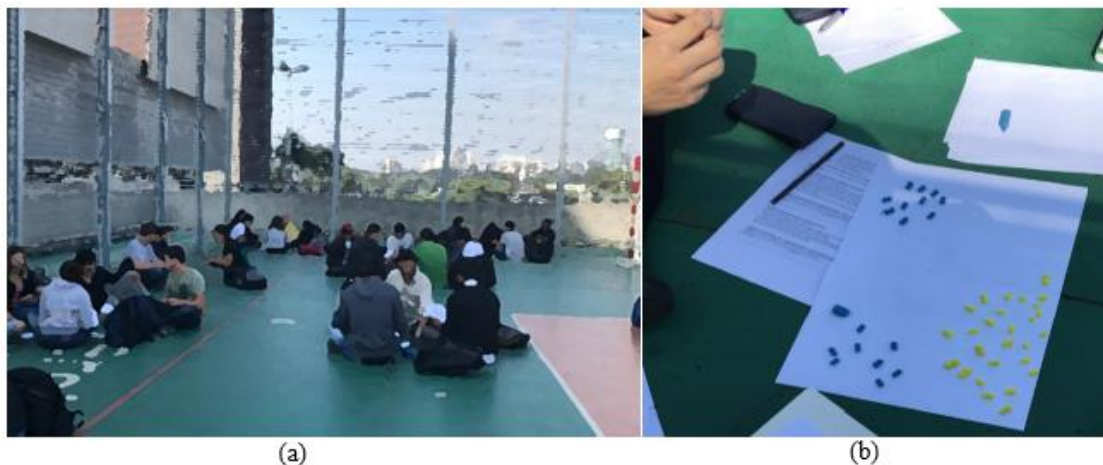
FIGURA 1. (a) Alunos na quadra de esportes da Universidade e (b) Exemplo de montagem de sistema com as massas de modelar

Dessa maneira, a atividade proposta foi ministrada numa quadra de esportes da Universidade (figura 1a), com duração de 2 horas. Os alunos foram dispostos em grupos de 5 ou 6 componentes, sendo que todos eles fizeram a montagem de 6 sistemas com transformações químicas reversíveis, utilizando-se massas de modelar (figura 1b).